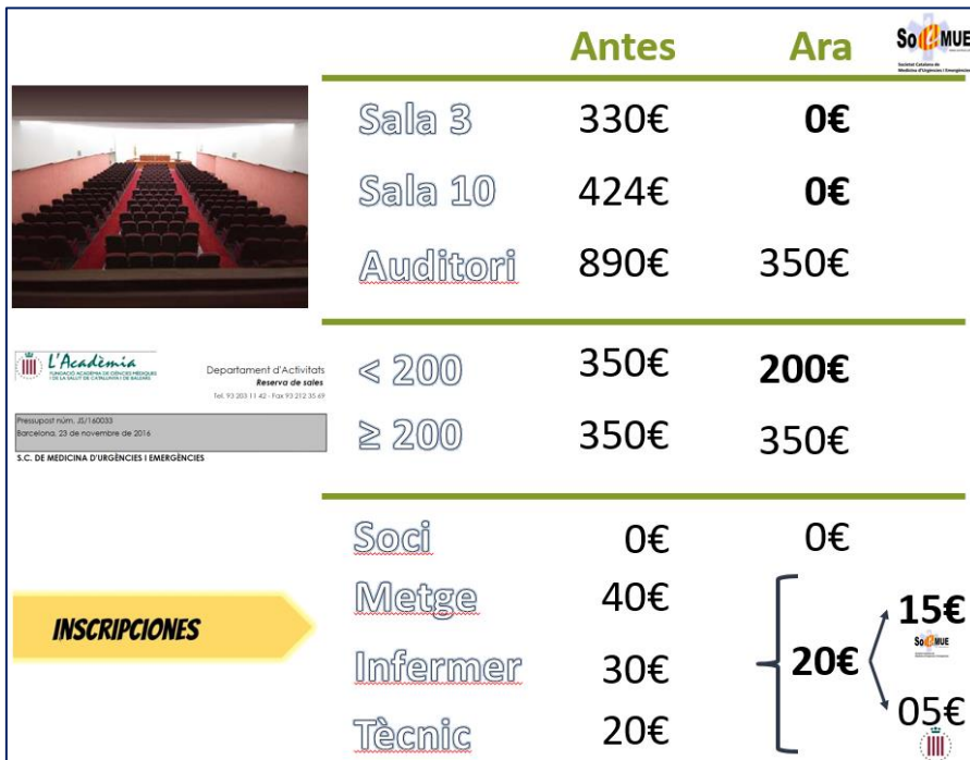
Figura 3.- Balanç econòmic de les Jornades d'Actualització.